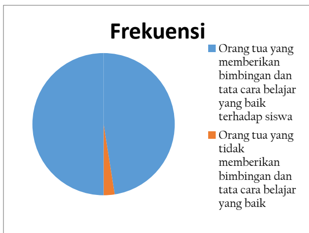
Gambar 2. Diagram persentase pemberian bimbingan belajar

Dari tabel 2, dilihat ada 19 (95%) dari 20 responden yang menerima pemberian bimbingan dan tata cara belajar yang baik dari orang tuanya dan hanya 1 responden yang tidak menerima bimbingan dan tata cara belajar yang baik dari orang tuanya