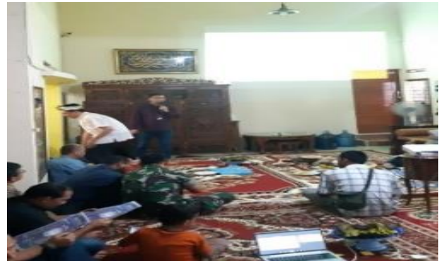
Gambar 4: Kegiatan Sosialisasi bersama agen perisai PWS

membantu menjembatani BPJS Ketenagakerjaan kepada sekelompok tenaga kerja, hal ini penting dikarenakan agen perisai merupakan salah satu strategi BPJS Ketenagakerjaan dalam mempercepat perluasan kepesertaan sehingga agen perisai juga harus dapat memahami dan mendukung kebijakan terkait program ini.