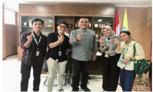
Gambar 3: Koordinasi peserta MBKM dengan Rektor UNP dalam melindungi peserta atlet POMANS 2022

Dalam upaya percepatan penerapan program BPJS Ketenagakerjaan, tidak hanya melakukan komunikasi dengan pihak terkait, tetapi diperlukan juga koordinasi yang baik diantara kedua belah pihak. Hal ini ditujukan agar percepatan penerapan program BPJS Ketenagakerjaan dapat berjalan dengan efektif dan efisien. Seperti adanya komunikasi dan koordinasi yang dilakukan oleh BPJS Ketenagakerjaan Kota Padang dengan Rektor UNP dalam hal melindungi seluruh atlet POMNAS 2022.