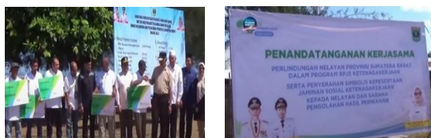
Gambar 1: Kegiatan Sosialisasi kepada Nelayan dan Penandatanganan Kerjasama dengan Gubernur Sumatera barat

Upaya dalam perluasan penerapan Program Jaminan Sosial Ketenagakerjaan yang dilakukan oleh BPJS Ketenagakerjaan Kota Padang yaitu dengan mengencangkan sosialisasi mengenai program jaminan sosial ketenagakerjaan kepada wadah tenaga kerja dan seluruh tenaga kerja adanya kerjasama dan koordinasi yang dilakukan dengan pihak pemerintah dan eksternal terkait dalam membantu perluasan kepesertaan dan terdapat inovasi dalam pelayanan program dalam upaya memberikan keadilan hak dan informasi yang sama kepada seluruh masyarakat agar seluruh masyarakat dapat mengetahui, memahami dan merasakan manfaat program jaminan sosial ketenagakerjaan dengan adil. Oleh karena itu, melalui inovasi media digital ini diharapkan masyarakat akan merasa dipermudah dalam memahami dan melakukan kegiatan administrasi kepesertaan.