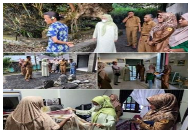
Gambar 3. Kunjungan dari Dinas Pariwisata, Pemuda, dan Olahraga Kabupaten Tanah Datar untuk meninjau persiapan Nagari Tuo Pariangan sebelum penilaian 50 Besar Desa Wisata ADWI 2022 di beberapa lokasi wisata sejarah, budaya, dan sentra batik Pariangan.

Berdasarkan tabel di atas, dapat dilihat bahwa keseluruhan pihak yang terlibat dalam pengembangan Desa Wisata Nagari Tuo Pariangan memiliki keterlibatan yang saling mempengaruhi antara satu sama lain. Tidak hanya dari kalangan Pemerintah, tetapi juga terdapat kalangan swasta, akademisi, dan komunitas yang ikut berpartisipasi dalam mengembangkan Desa Wisata Nagari Tuo Pariangan hingga terjadi peningkatan jumlah kunjungan Nagari Tuo Pariangan di tahun 2021-2022. Tabel di atas diikuti dengan beberapa dokumentasi yang menunjukkan bentuk kolaborasi pada gambar di bawah ini :