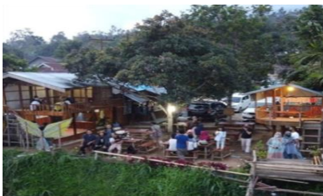
Gambar 4. Kedai Kawa Daun Tanjung Indah Sumber: Instagram (@kawadaun.tanjungindah) 2021

Meskipun telah terjadi peningkatan jumlah kunjungan wisatawan, namun belum berdampak pada masyarakat umum dan hanya dirasakan oleh beberapa masyarakat saja. Salah satunya pada masyarakat yang memiliki lahan khusus untuk pendirian kedai kawa daun seperti pada gambar di bawah ini: