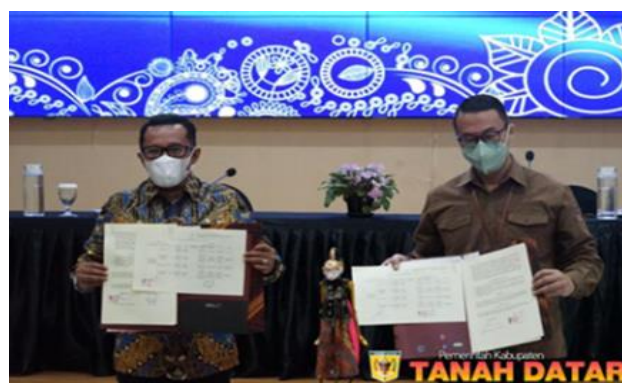
Gambar 2. Nota Kesepakatan (MoU) Pemerintah Kabupaten Tanah Datar dengan Sekolah Tinggi Pariwisata (STP) Bandung

Selanjutnya diikuti dengan terjalannya kerja sama dengan Komunitas Tanah Datar Tourism (TDT), Sekolah Tinggi Pariwisata (STP Bandung), ASTRA selaku mitra Kementerian Pariwisata dan Ekonomi Kreatif (Kemenparekraf), perguruan tinggi sekitar, seperti Universitas Andalas (UNAND), Universitas Negeri Padang (UNP), dan Universitas Islam Negeri (UIN) Mahmud Yunus, Institut Seni Indonesia (ISI) Padang Panjang, masyarakat Nagari Tuo Pariangan, dan pengunjung terutama turis mancanegara. Berikut ini ditampilkan salah satu gambar yang menunjukkan kesepakatan bersama.