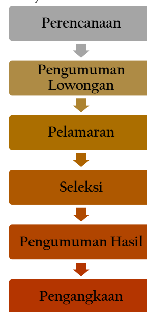
Gambar 1. Tahapan dalam Pengadaan PPPK Guru

Terdapat beberapa tahapan pokok yang dijalankan dalam pengadaan PPPK Guru yakni: