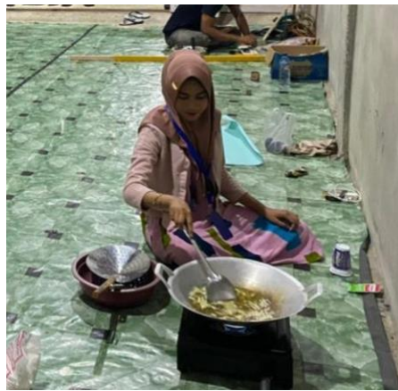
Gambar 5. Proses Penggorengan