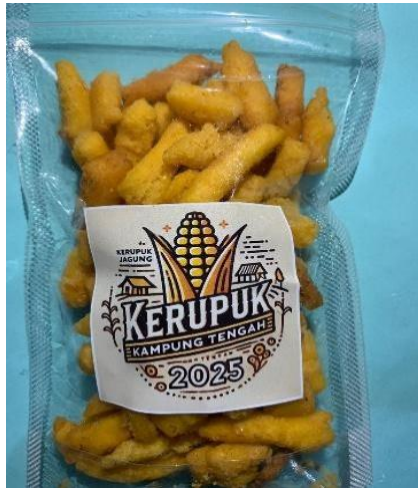
Gambar 6 Pengemasan Kerupuk Jagung