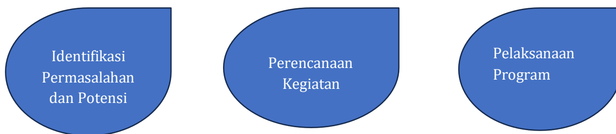
Gambar 1. Bagan Alir Kegiatan PAR