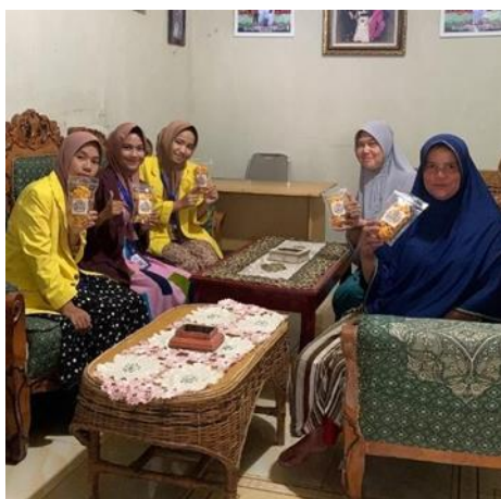
Gambar 7. Pembagian Kerupuk Jagung

Dalam proses pembuatan kerupuk jagung, partisipasi ibu-ibu dan masyarakat di Desa Kampung Tengah memiliki peran yang sangat penting. Ibu-ibu di desa ini umumnya memiliki keterampilan dalam memasak, sehingga keterlibatan mereka tidak hanya membantu dalam proses produksi kerupuk, tetapi juga berkontribusi dalam meningkatkan perekonomian keluarga. Melalui kegiatan ini, ibu-ibu diajak untuk memasak bersama, sekaligus diberikan pendampingan mengenai pengolahan produk lokal menjadi produk bernilai jual tinggi. Dengan pengetahuan dan keterampilan baru ini, diharapkan mereka dapat lebih kreatif dalam mengolah bahan pangan lokal, mampu menciptakan produk kuliner inovatif, serta memiliki keterampilan wirausaha untuk mendukung ekonomi berkelanjutan. Program ini juga memberikan kesempatan kepada masyarakat untuk mengembangkan usaha kecil berbasis potensi lokal, membuka lapangan kerja baru, dan memperkuat ekonomi desa melalui peningkatan kualitas produk dan strategi pemasaran yang lebih luas, termasuk memanfaatkan media digital untuk memperluas pangsa pasar.