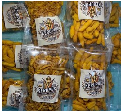
Gambar 2. Kerupuk Jagung

Adapun proses pembuatan kerupuk jagung dilakukan di salah satu rumah warga di Desa Kampung Tengah, Kecamatan Kuala Batee, Kabupaten Aceh Barat Daya, Aceh, Indonesia. Kegiatan ini dimulai dengan pemberian penjelasan mengenai fungsi, kandungan nutrisi, dan berbagai manfaat dari kerupuk jagung tersebut. Setelah sesi penjelasan selesai, kerupuk yang telah dibuat kemudian dibagikan kepada para peserta. Sekitar 90% ibu-ibu yang mengikuti kegiatan ini menyatakan kepercayaan mereka terhadap kualitas dan manfaat kerupuk tersebut. Selain itu, para peserta juga memberikan tanggapan positif terhadap pelaksanaan kegiatan, menunjukkan antusiasme dan apresiasi yang tinggi.