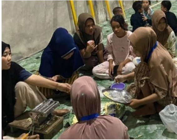
Gambar 4. Proses Proses penggilingan adonan