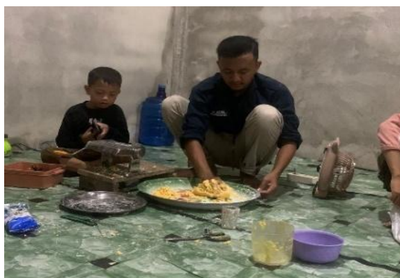
Gambar 3. Proses Pengolahan Adonan Kerupuk Jagung

Berikut ini adalah proses pembuatan kerupuk jagung, yang melibatkan pengolahan jagung lokal, pembuatan adonan, penggorengan, hingga pengemasan produk dengan standar higienis dan tampilan yang menarik guna meningkatkan daya saing produk di pasar.