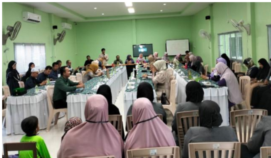
Gambar 1. Sambutan Ketua Al-Hidayah Waqaf Foundation for Education for Social Development

Ketua Al-Hidayah Waqaf Foundation for Education for Social Development memberikan sambutan dan menyatakan institusinya sangat terbuka untuk bekerja sama dengan berbagai universitas di seluruh dunia. Dikatakannya, sebagai institusi Pendidikan pihaknya selain menyelenggarakan Pendidikan juga memberikan beasiswa bagi warga Thailand dari tingkat dasar hingga perguruan tinggi. Karena itu, kedatangan tim PKM diharapkan juga mampu memperluas kerja sama Al-Hidayah. Dikatakannya, paparan yang disampaikan para pembicara dari kalangan dosen dapat menambah bagi para guru, siswa dan komunitas masyarakat yang hadir pada kegiatan itu.