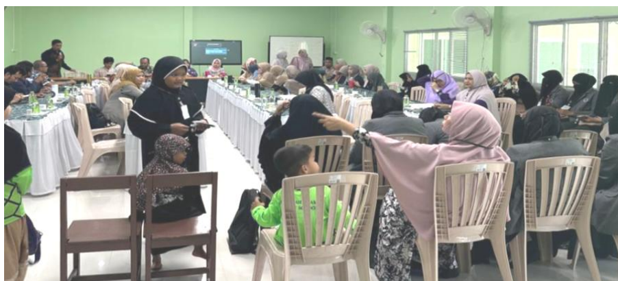
Gambar 3. Peserta Pengabdian Kepada Masyarakat (PKM) Internasional

Sesi ini mengidentifikasi kebutuhan spesifik yang dapat dijadikan fokus pengembangan program lebih lanjut.