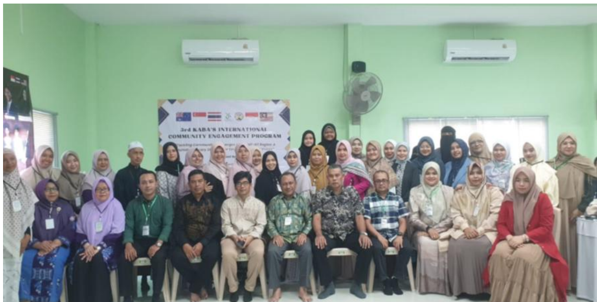
Gambar 6. Foto Bersama Pasca Kegiatan