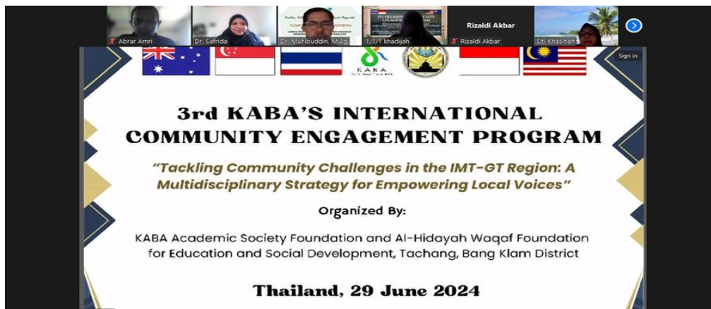
Gambar 5. Penyampaian Materi secara Hybrid