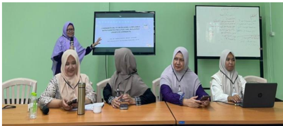
Gambar 2. Dokumentasi kegiatan pengabdian