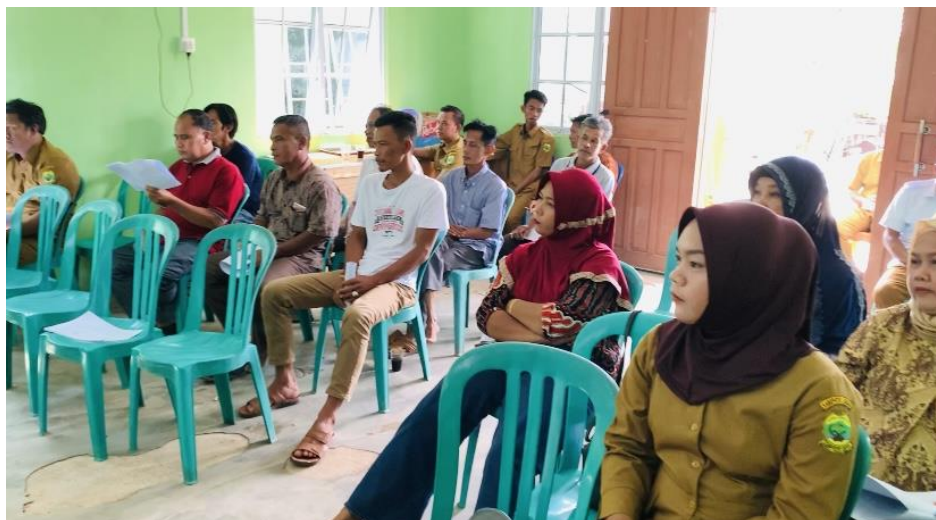
Gambar 4. Antusias peserta sosialisasi

dari keberhasilan upaya advokasi yang dilakukan dalam memperjuangkan alokasi Dana Desa (Prabaningrum & Abheseka, 2020). Terdapat tiga katagori alokasi yang dianggap sebagai anggaran responsif gender, yaitu: (1) anggaran belanja khusus yang diperuntukan bagi pemberdayaan perempuan dan peningkatan kualitas hidup perempuan; (2) alokasi anggaran belanja rutin untuk meningkatkan kapasitas kerja laki-laki dan perempuan dalam pemerintahan; dan (3) alokasi anggaran belanja umum bagi pengarusutamaan gender.