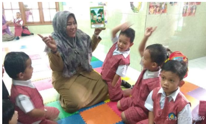
Gambar 6. Antusiasme murid dalam menerima pembelajaran dari Flashcard

Respon awal dapat dilihat adanya antusiasme yang tinggi dari murid-murid TK dalam menyimak materi pembelajaran dengan APE yang diberikan. Karakter kartun yang menarik menimbulkan semangat belajar dan peningkatan pemahaman terhadap materi yang diajarkan. Selain itu, murid berhasil mengidentifikasi kesadaran akan kebersihan yang tergambar dalam karakter flashcard maupun buku mewarnai yang diberikan. Gambar 6 menunjukkan antusiasme murid dalam menerima pembelajaran dari guru TK menggunakan APE flashcard dan Gambar 7 menunjukkan kegembiraan murid-murid di salah satu TK Mitra Pengabdian setelah mendapatkan buku mewarnai dan alat tulis menggambar.