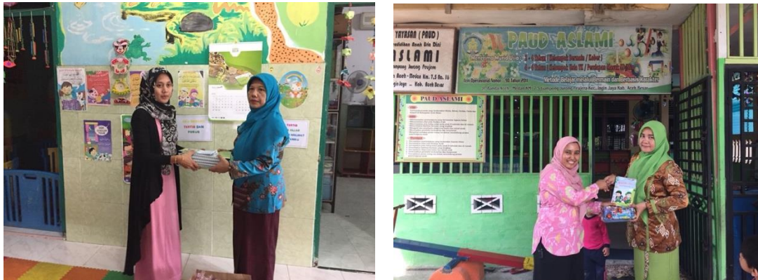
Gambar 5. Penyerahan APE kepada TK mitra pengabdian secara simbolis

Aktivitas selanjutnya adalah membagikan APE flashcard dan buku mewarnai melalui kepala sekolah secara simbolis. Setelah diterima secara resmi, maka APE dapat digunakan sebagai media pembelajaran dan dibagikan kepada murid-murid TK mitra pengabdian. Contoh pembagian APE kepada murid dapat dilihat pada Gambar 5.