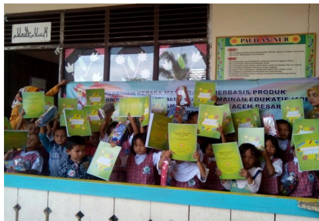
Gambar 7. Kegembiraan murid menerima buku dan alat tulis mewarnai