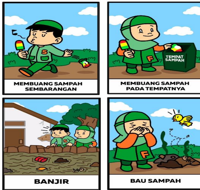
Gambar 2. Desain produk flashcard tema kebersihan