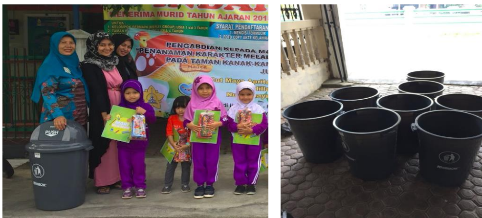
Gambar 8. Tempat sampah yang diserahkan kepada TK mitra pengabdian

Diakhir kegiatan pengabdian ini juga, tim pengabdian memberikan 2 unit tempat sampah kepada masing-masing TK mitra Pengabdian. Hal ini diharapkan supaya murid-murid tidak hanya mendapatkan ilmu secara teori tetapi juga mampu mengaplikasikan pentingnya pembelajaran sejak dini untuk selalu membuang sampah pada tempatnya. Gambar 8. menunjukkan contoh tempat sampah yang diberikan kepada salah satu TK mitra pengabdian.