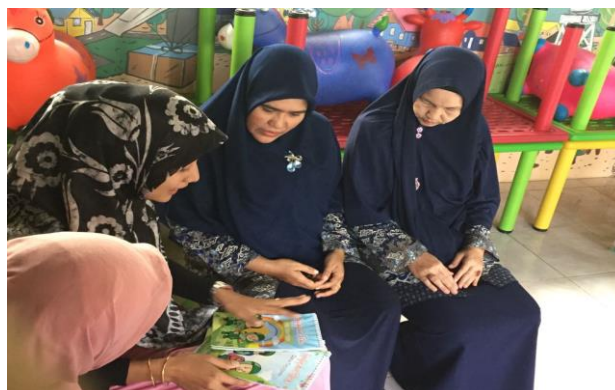
Gambar 4. Sosialisasi penggunaan APE oleh tim pengabdian

Setelah produk dicetak, tim pengabdian melakukan sosialisasi produk dengan menunjungi TK mitra. Langkah pertama dalam sosialisasi produk adalah memberitahukan fungsi dari APE kepada guru-guru TK serta cara menggunakannya. Gambar 4 menunjukkan sosialisasi fungsi APE dari tim pengabdian kepada guru-guru TK mitra pengabdian.