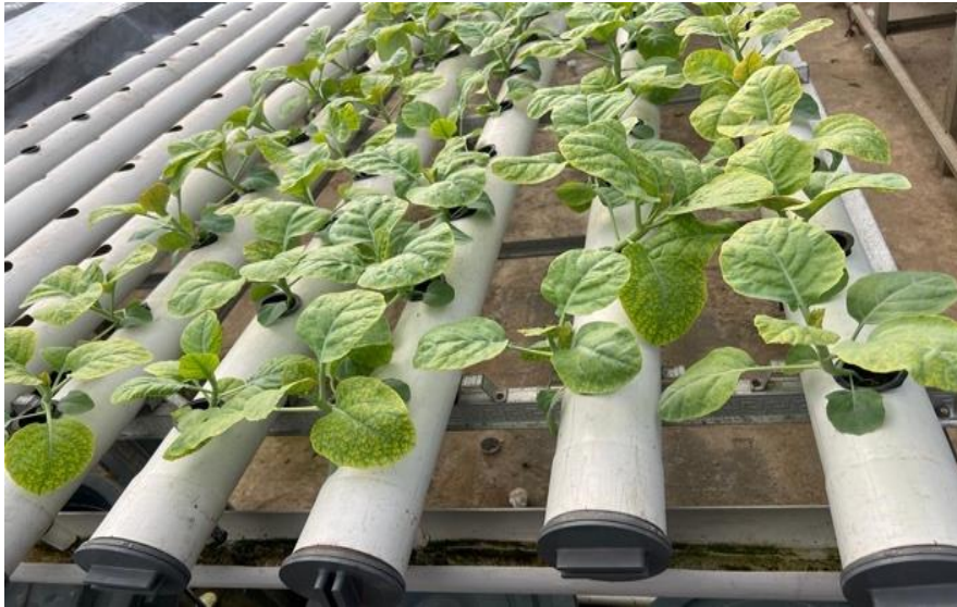
Gambar 2. Sistem water culture (WCS) tanaman pokcoy

Panen dilakukan sesuai dengan kriteria tanaman ini yaitu setelah tanaman berumur 30- 35 hari setelah tanam (HST). Ciri-cirinya adalah daun tanaman dewasa, tangkai daun berwarna hijau cerah, bentuknya relatif pendek. Panen dilakukan pada kondisi cuaca cerah. Panen dilakukan dengan cara mencabut tanaman dari net pot beserta akarnya. Rockwool yang melekat pada akar dilepaskan dari perakaran tanaman.