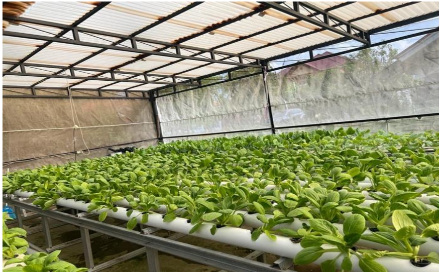
Gambar 3. Sistem WCS dan DFT pada tanaman