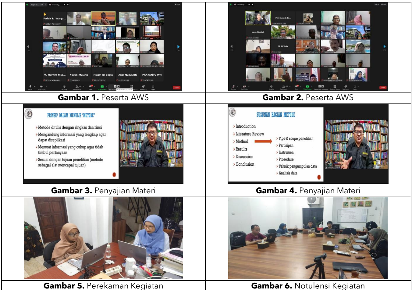
Dokumentasi Kegiatan Academic Writing Series

Pelaksanaan kegiatan didukung oleh Tim PKM yang terlibat dalam setiap pekan. Di antara kegiatan yang ada, seperti yang telah disinggung sebelumnya, selain pemaparan materi, juga diisi dengan sesi tanya jawab serta pencatatan dan perekaman kegiatan. Secara ringkas, visualisasi kegiatan dapat dilihat pada beberapa yang dimuat pada Tabel 3 berikut.