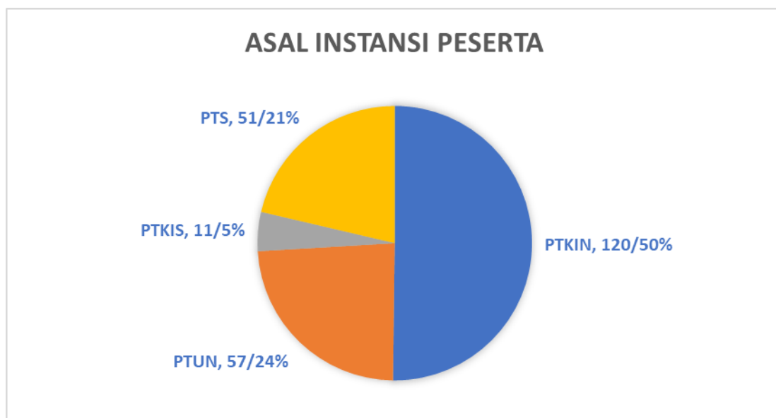
Gambar 1. Sebaran Asal Institusi Peserta AWS

Peserta AWS berasal dari berbagai perguruan tinggi (PT) di Indonesia. Mereka berasal dari PT umum, agama baik negeri maupun swasta. Peserta yang terlibat dalam kegiatan ini umumnya dari Perguruan Tinggi Keagamaan Islam Negeri (PTKIN). Secara ringkas, asal instansi atau PT peserta dapat dilihat pada Gambar 1 berikut.