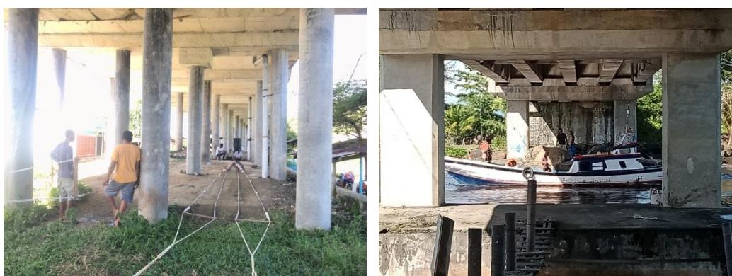
Gambar 3. Pembuatan Alat Tangkap dan persiapan nelayan sebelum berlayar

Mereka bekerja setiap hari kecuali pada hari Jum'at, dikarenakan mayoritas masyarakat desa sebagai nelayan merupakan seorang muslim, dan berjenis kelamin Laki-laki sehingga pada hari Jum'at seluruh para nelayan memilih untuk tidak beraktifitas ke laut. Maka dari itu, sebagian besar kegiatan masyarakat di Desa Kuala Bubon ialah pada sektor perikanan dan kelautan, seperti pada Gambar 3.