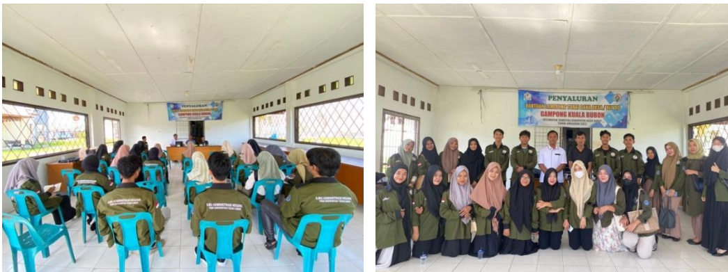
Gambar 5. Dokumentasi pada saat Sosialisasi

Dalam hal ini, untuk ketiga unsur tersebut sudah tercapai, dikarenakan masyarakat desa telah memiliki kesempatan yang sama untuk berpartisipasi mulai dari ikut serta Musrenbang Desa, adanya komunikasi antara pemerintah desa dan masyarakat, dan adanya kesempatan untuk mengembangkan kemampuan yang mereka miliki melalui berbagai program yang dibentuk oleh pemerintah desa tersebut, seperti mengikuti pelatihan sulaman kasab dan pendidikan terkait pemanfaat budidaya Mangrove sebagai bentuk mitigasi bencana. Kemudian masyarakat desa juga memiliki kemauan untuk berpartisipasi, dalam hal ini masyarakat sudah mulai sadar dan peka terhadap berbagai program pemberdayaan masyarakat di Desa Kuala Bubon.