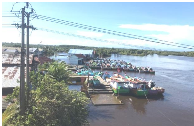
Gambar 4. Tempat Bersandar perahu masyarakat nelayan.

Terkait keempat peranan tersebut, Desa Kuala Bubon dalam meningkatkan pertumbuhan ekonomi telah berperan sebaik mungkin, dalam hal ini pemerintah desa telah menjadi Fasilisator bagi masyarakat dengan menyediakan sarana seperti ketersediaan transportasi yang mencapai 20 Boat, Tempat sandaran Kapal, Tempat Perdagangan Ikan (TPI), serta akses perdagangan hasil tangkap, namun pemerintah desa belum mampu menyediakan alat pendingin ikan bagi masyarakat dikarenakan biaya operasi dan teknologi masih cukup terbatas. Selain itu, pemerintah desa juga sudah berperan sebagai Dinamisator atau penggerak dalam menyelesaikan sebuah permasalahan di lingkungan masyarakat, yang telah dilakukan oleh pemerintah desa Kuala Bubon diantaranya ialah membentuk program pendidikan bagi masyarakat terkait edukasi penggunaan alat tangkap ikan, budidaya nipah dan ekowisata nipah.