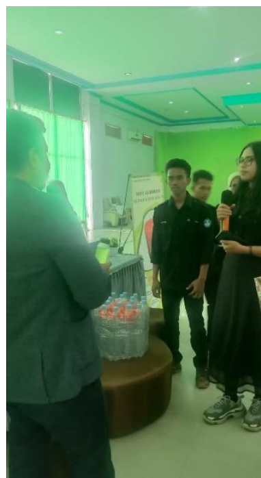
Gambar 5. Dokumentasi Pemasaran Secara Offline