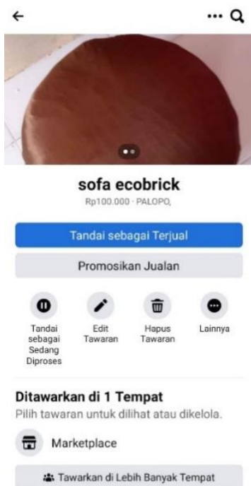
Gambar 4. Dokumentasi Pemasaran Secara Online

Dari hasil evaluasi maka dilakukan pertimbangan untuk produksi yang akan dilakukan mendatang. Dilihat dari kualitas produknya sangatlah aman untuk digunakan dengan kekuatan yang kokoh serta fungsinya yang dapat digunakan selain menjadi furniture rumahan. Biaya yang dikeluarkan dalam produksi sangatlah murah melihat dari peralatan dan bahan yang digunakan. Untuk harga jual dan tempat pemasaran masih bersaing dengan produk yang lainnya. Dikarenakan produk masih baru dan belum memiliki nama yang membuat produk bisa bersaing di pasar. Berikut pada gambar 4 dan 5 adalah dokumentasi pemasaran produk sofa ecobrick secara online dan offline: