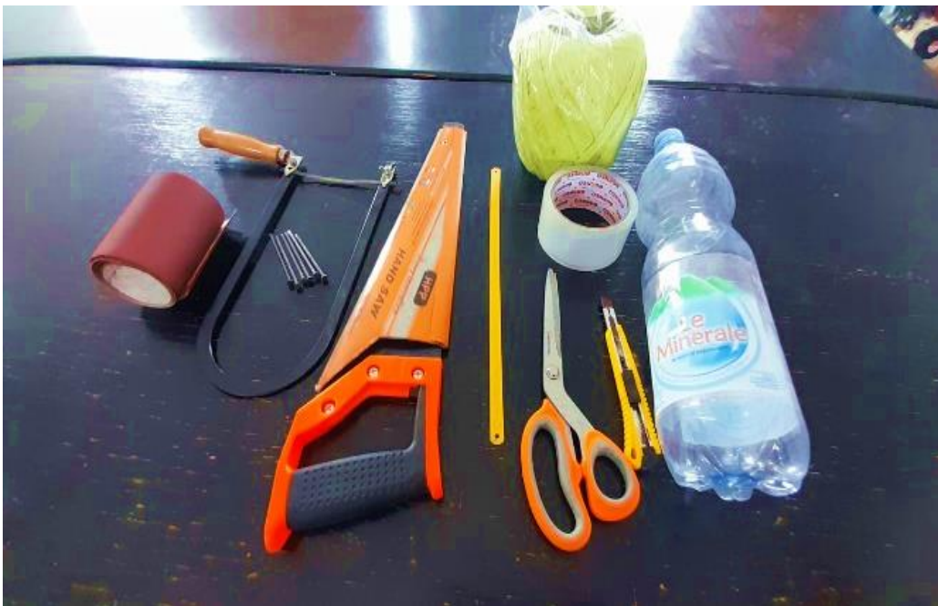
Gambar 1. Alat dan Bahan Pembuatan Sofa Ecobrick