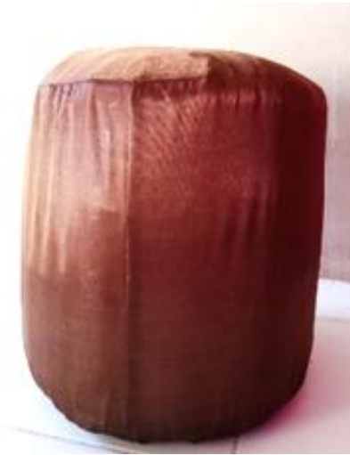
Gambar 3. Output produk Sofa Ecobrick