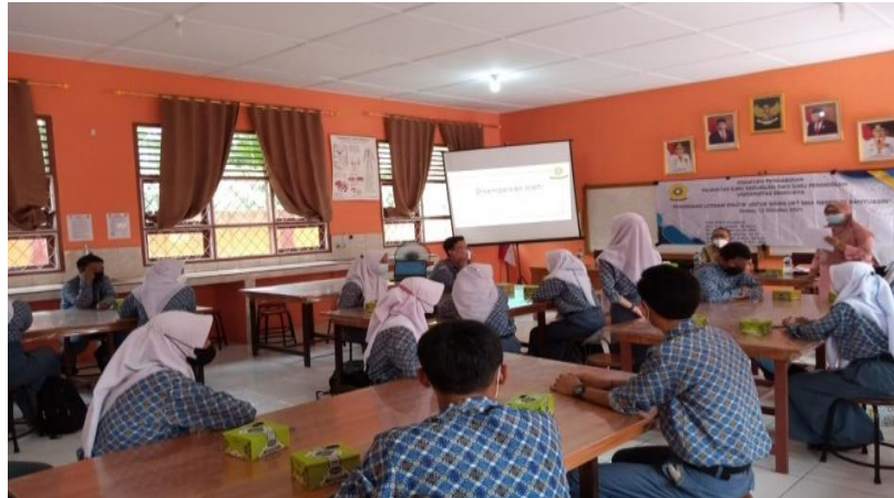
Gambar 3. Sosialisasi Pengenalan Demokrasi Digital Melalui Media Sosial

mengenai Pendidikan Literasi Politik ini disambut antusias oleh siswa-siswi SMA Negeri 25 Banyuasin Propinsi Sumatera Selatan. Pemaparan materi sosialisasi yang disampaikan oleh para pemateri memberi kesan tersendiri bagi siswa SMA Negeri 25 Banyuasin.