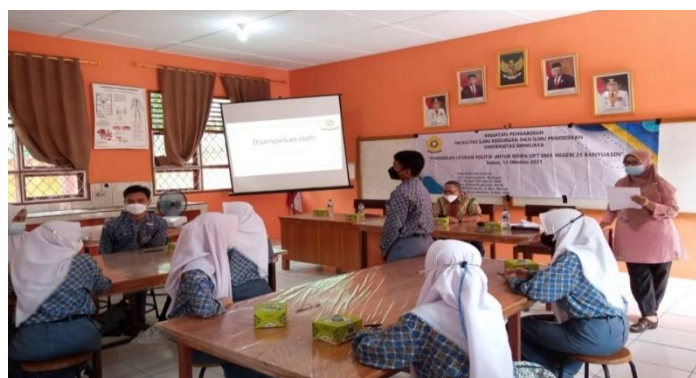
Gambar 2 Materi Edukasi Politik Digital

Pendidikan politik merupakan bagian dari sosialisasi politik. Pendidikan politik mengajarkan masyarakat untuk lebih mengenal sistem politik negaranya. Dapat dikatakan bahwa sosialisasi politik adalah proses pembentukan sikap dan orientasi politik para anggota masyarakat. Melalui proses sosialisasi politik inilah para anggota masyarakat memperoleh sikap dan orientasi terhadap kehidupan politik yang berlangsung dalam masyarakat (Bashori, 2018). Pendidikan politik penting untuk diberikan kepada generasi muda terutama bagi para pemilih pemula. Minimnya informasi yang mereka dapatkan mengenai politik, membuat mereka cenderung apatis terhadap semua proses tahapan dalam rangka pemilu maupun pemilukada. Hal ini membuat, perlunya sosialisasi terkait literasi politik yang merupakan salah satu proses pembelajaran terhadap generasi muda agar dapat mensukseskan dan mampu menjalankan semua proses tahapan yang ada dalam pemilu maupun pemilukada. Selain itu, dengan adanya literasi politik diharapkan generasi milenial memiliki kesadaran dan menggunakan hak pilih yang dimilikinya untuk ikut serta dalam proses pemilihan umum/pemilukada, seperti ikut dalam kampanye, melakukan pencoblosan terhadap pasangan calon yang diyakininya dan lain sebagainya.