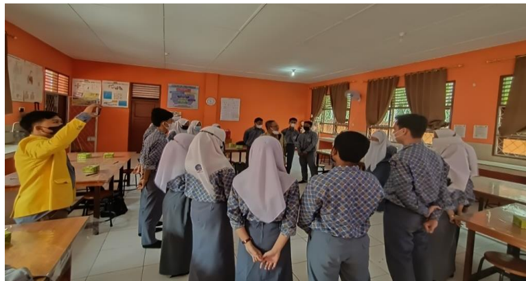
Gambar 4. Games dan Outbond

Permainan ini dilaksanakan di akhir kegiatan pengabdian (Gambar 3). Permainan ini adalah sebuah aktivitas atau kegiatan berupa permainan yang dirancang khusus bagi siswa agar dapat membentuk jiwa kepemimpinan dan membangun kerjasama kelompok dalam diri siswa tersebut. Selain itu, mampu mengasah public speaking bagi siswa yang suka melakukan aktivitas secara berkelompok. Sesi permainan ini memiliki tujuan untuk: 1) Mampu membentuk jiwa kepemimpinan dan berani mengambil keputusan; 2) mampu meningkatkan rasa sportivitas dalam kelompoknya; 3) Mampu meningkatkan motivasi serta kerjasama kelompok; 4) Mampu meningkatkan public speaking secara efektif; 5) Mampu rasa komitmen pada aturan yang telah ditetapkan bersama; 6) Mampu menumbuhkan semangat berkompetisi secara sehat untuk mencapai tujuan bersama; 7) Mampu menumbuhkan sikap pantang menyerah dalam menyelesaikan segala persoalan; 8) Mampu membuat perencanaan secara rinci dan matang, sehingga timbul koordinasi tim yang solid; 9) Mampu mengambil keputusan secara tepat dan efektif pada saat situasi yang sulit (Efendi, 2020).