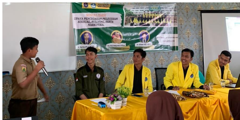
Gambar 2. Sesi Tanya jawab

Sosialisasi ini terlaksana di salah satu sekolah menengah pertama yang berada di Kabupaten Aceh Barat yaitu SMP Negeri 3 Meulaboh, dengan jumlah siswa-siswi yang berpartisipasi dalam sosialisasi sebanyak 40 orang dari tingkatan kelas yang berbeda-beda. Dalam proses sosialisasi tersebut, partisipasi dari siswa-siswi cukup tinggi. Hal ini terlihat dari proses tanya jawab yang berlangsung. Banyak pertanyaan yang diajukan oleh peserta kepada materi terkait bullying , narkoba dan pelecehan seksual. Dari partisipasi yang tinggi tersebut, diharapkan mampu menambah wawasan dan pemahaman bagi siswa-siswi terkait ketiga tema pemaparan yang telah disampaikan.