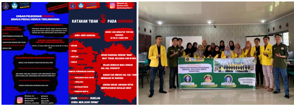
Gambar 3. Poster dan Spanduk