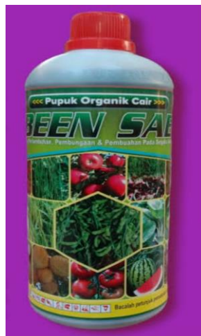
Gambar 2. Kemasan Pupuk Hayati Been Sae