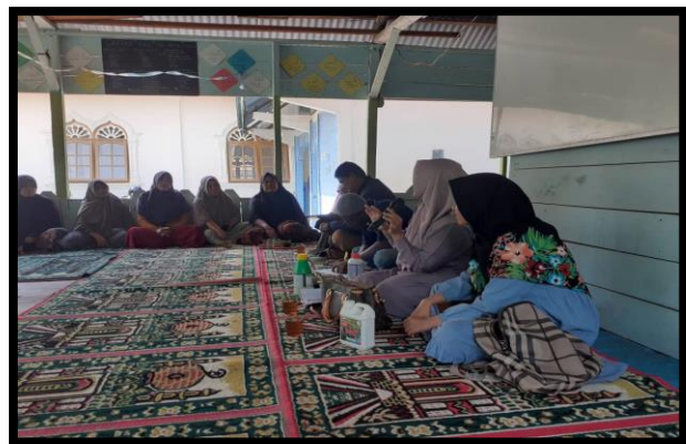
Gambar 3. Penyuluhan, pendampingan dan sosialisasi bersama kelompok tani tentang pupuk hayati Been Sae